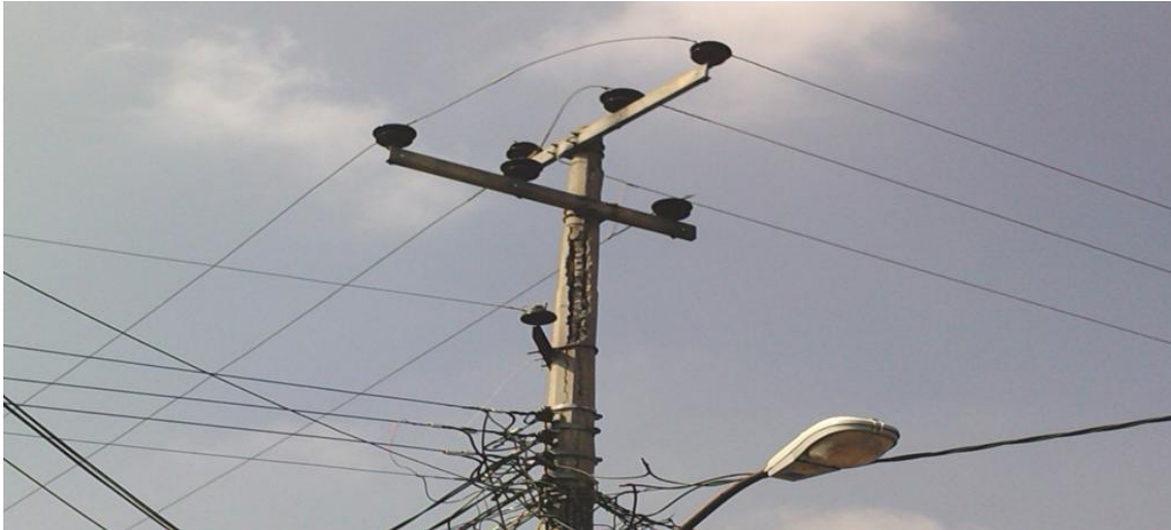
Figura 4.5 Poste de concreto reforzado deteriorado por el tiempo con las varillas expuestas.

Otro tipo de daños por este tipo de sismos son, que al moverse por efecto de sismo los postes de concreto reforzado de más de 20 años de vida útil, provocan la caída de pedazos de concreto como el que se muestra en la figura 4.5 y por consiguiente la exposición de varillas a la intemperie y su inminente oxidación y corrosión que aumentan su posible caída, lo cual se vería reflejado inmediatamente en la interrupción del flujo eléctrico.