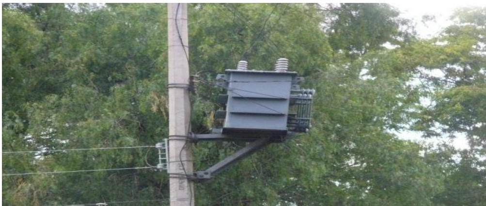
Figura 4.7 Transformador trifásico aéreo recorrido de su base al borde de su plataforma.

Otra de las consecuencias que se generan por este tipo de sismos son el de “recorrido” de su base de transformadores como el que se ve en figura 4.7. Esto es que los transformadores trifásicos aéreos se deslizan sobre su plataforma de sustentación, soportada en postes de concreto reforzados y de acero troncocónicos en donde son instalados, quedando al borde de caerse y el peligro inminente para la sociedad. En esta imagen se puede apreciar un transformador aéreo al borde de su plataforma, en el caso de un sismo del rango antes mencionado es muy posible que se venga abajo. Este transformador trifásico aéreo está ubicado en Av. Miramontes casi esquina Calle Cerro de las Campanas delegación Coyoacán. Y como este ejemplo hay muchos.