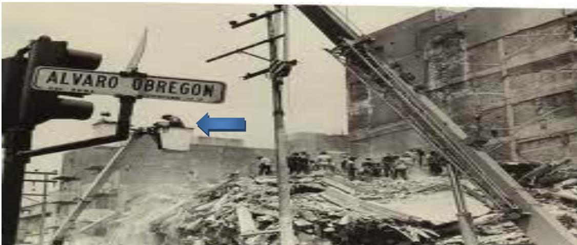
Figura 4.11 Edificio derrumbado por el sismo de 1985.

En la figura 4.11 se aprecian los trabajos después del sismo de 1985 de reinstalación de la red aérea de mediana tensión por parte de los trabajadores de líneas aéreas de Luz y Fuerza del Centro (L yFC). En esta imagen se aprecia una “jirafa” con canastilla doble con sus ocupantes reinstalando las líneas de mediana tensión, frente al edificio que se encontraba en Av. Insurgentes Esquina Álvaro Obregón de la colonia Roma.