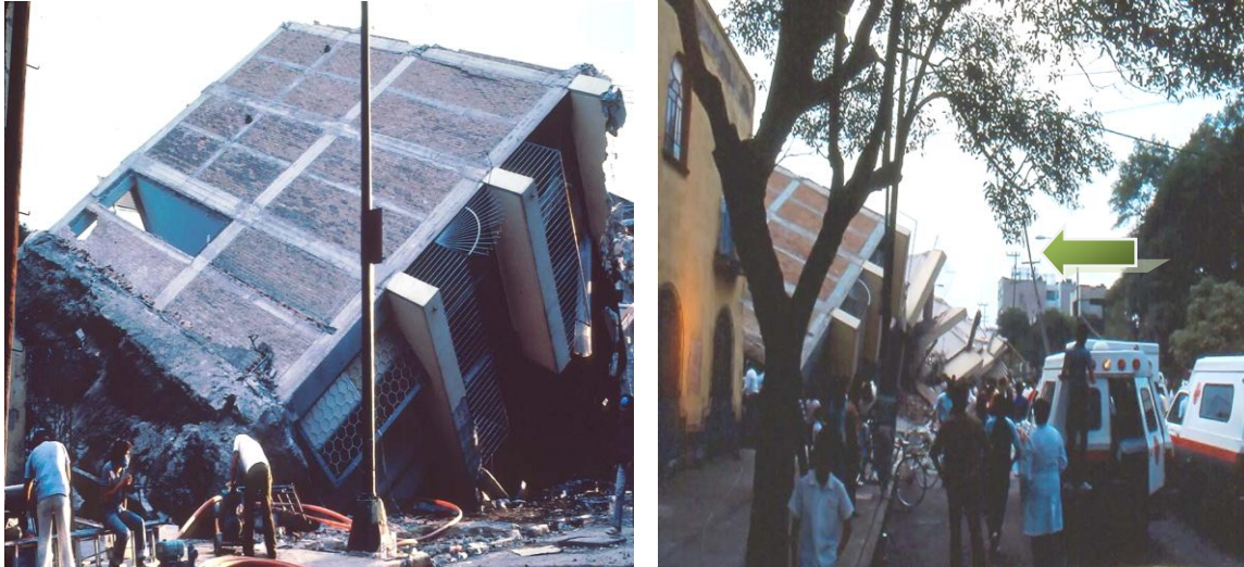
Figura 4.12 Edificio de departamentos derribado en el sismo de 1985.

En la figura 4.12 se puede observar daños por el sismo de 1985 tanto a la infraestructura eléctrica subterránea como a la aérea, por un lado el edificio volcado sobre la acera por donde pasan la red subterránea y por otro lado postes de concreto reforzado desplomados con la red aérea de mediana tensión.