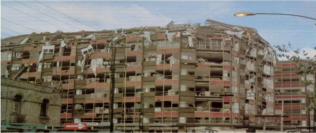
Figura 4.2 Secretaria de Comercio muy deteriorada por el sismo de 1985.