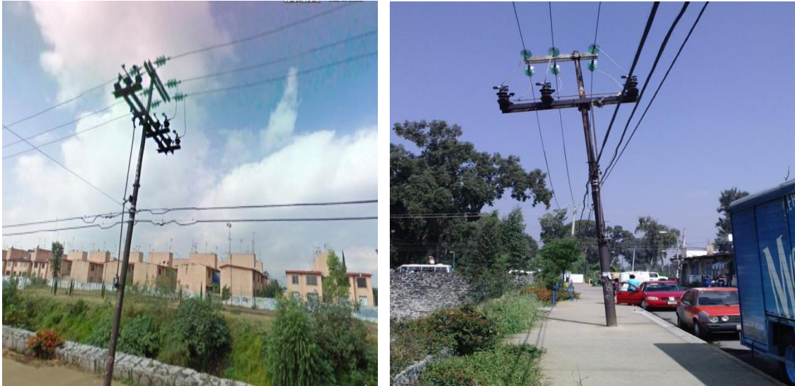
Figura 4.8 poste de acero troncocónico con equipo de seccionamiento manual desplomado con red troncal.

En mi experiencia no se atendieron estas anomalías por parte de Luz y Fuerza del Centro por cuestiones políticas que obligaban a la empresa y a los trabajadores a atender otras prioridades pero sin material, el cual en los últimos diez años hasta su extinción se fueron negando los materiales y los recursos a todos y cada uno de los departamentos. Pretexto perfecto para su extinción, el gobierno federal fue juez y parte.