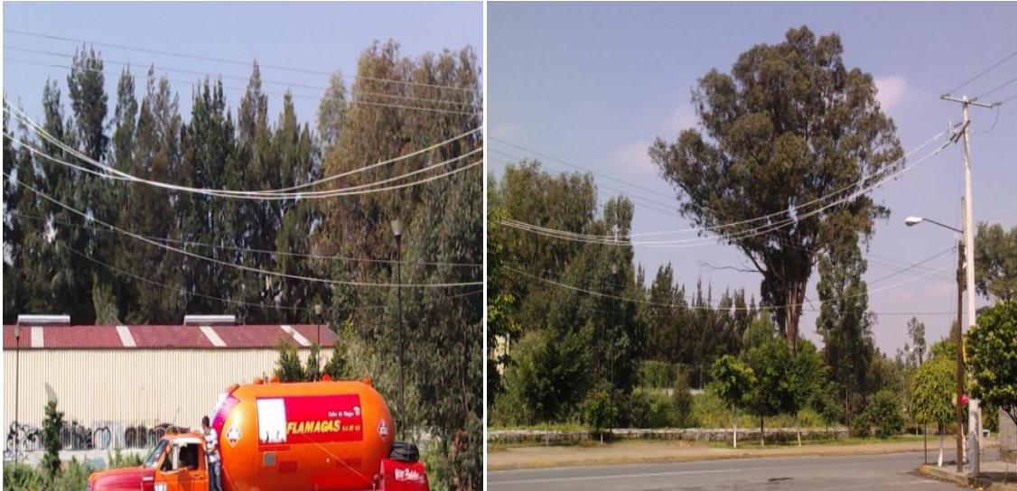
Figura 4.14 Línea de mediana tensión con exceso de catenaria muy peligrosa.

En la figura 4.14 se puede apreciar un ramal de mediana tensión con cable ACSR de calibre de 1/0, el cual está a no menos de 5 metros de altura, fuera de norma que es de 6.5 m, (de normas del Reglamento Técnico de Instalaciones Eléctricas RTIE) además en esta figura se muestra una pipa con gas pasando por debajo del ramal, si por alguna razón llegara a tocar las líneas de mediana tensión se provocaría un accidente de proporciones mayúsculas que afectaría no solo a la red eléctrica sino también a la población en un perímetro muy extenso, como este ejemplo hay muchos más, ya que es demasiado grande la Ciudad de México y su zona conurbada. Imágenes de la figura anterior, tomadas en el mes de junio del 2010.