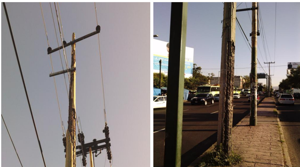
Figura 4.6 poste de concreto reforzado muy deteriorado por el tiempo con pedazos de concreto a punto de caer.

En la figura 4.6 se ve el peligro latente que representan los postes de más de 20 años de vida útil, ya que este poste se encuentra ubicado en una de las zonas más transitadas por personas y por vehículos, además existe muy cerca de ahí una base de transporte público que en horas pico está con mucha gente haciendo largas filas. Este poste está ubicado en Av. Universidad y Miguel A. de Quevedo.