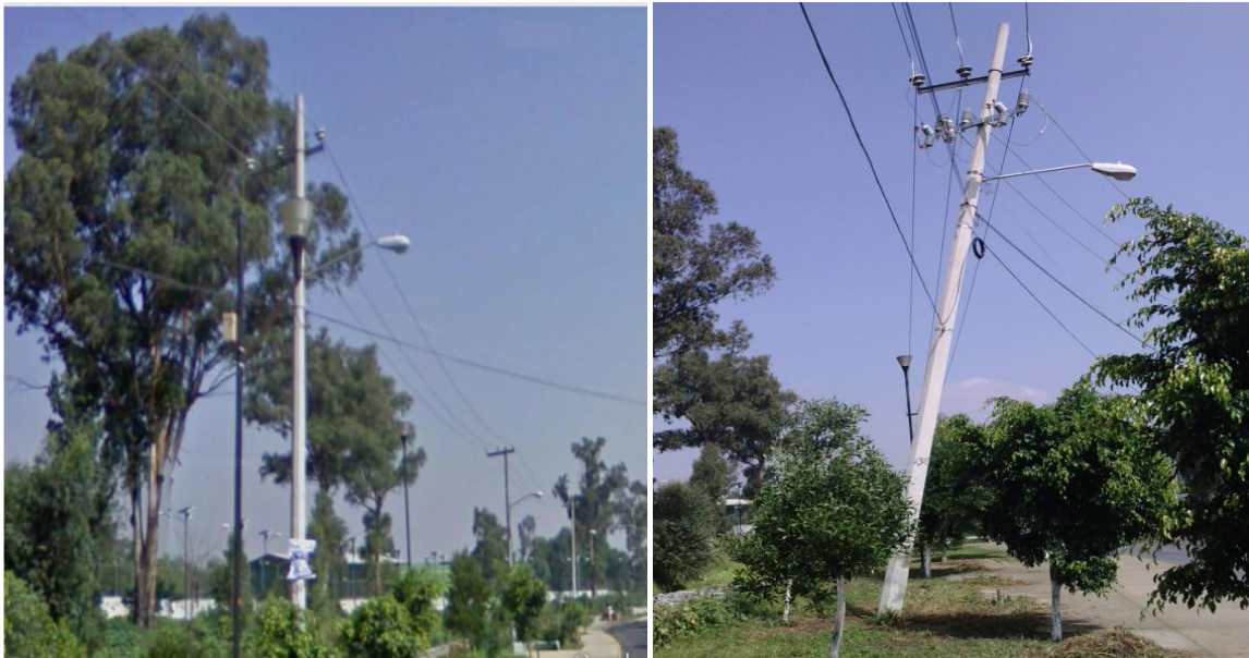
Figura 4.10 Poste de concreto reforzado antes y después de hacer un ramal.

En la figura 4.10 se muestra el mismo poste de concreto reforzado en fechas distintas, en la primera es del 14 de febrero de 2009, y el de la segunda es del 23 de septiembre de 2010, Se aprecia el poste plomado y luego desplomado unos 30 grados con respecto a la horizontal del suelo, este poste se afectó después de haber realizado un ramal o una derivación hacia un transformador trifásico aéreo, en forma incorrecta, ya que además de hacer mal el tendido eléctrico en el poste en forma diagonal, las líneas de mediana tensión están a una altura aproximada de 5 metros con respecto al arroyo vehicular, por el desplome (fuera de normas técnicas), además este trabajo se realizó por trabajadores subcontratados por la CFE, que a pesar de ver su trabajo mal hecho se fueron. Este poste está ubicado en la calle de Canal Nacional esquina con Relaciones Exteriores, colonia San Andrés Tomatlan delegación Iztapalápa.