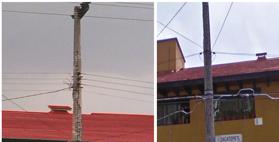
Figura 4.3 poste de concreto reforzado muy deteriorado por el tiempo.

En la figura 4.3 se aprecia la imagen de un poste de concreto reforzado muy deteriorado con las varillas expuestas a la altura de las líneas aéreas de distribución de baja tensión ubicado al sur de la ciudad en la Colonia Jardines del Pedregal, delegación Coyoacán. (Fecha de las imágenes; julio de 2010)