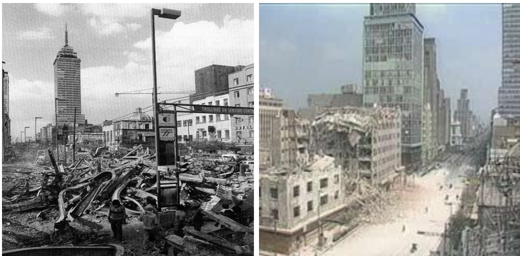
Figura 4.1 Edificios del centro derribados por el sismo de 1985 en Av. Lázaro Cárdenas o eje central.

Dependiendo de la intensidad del sismo provocan múltiples formas de daños a la infraestructura eléctrica que a su vez propician interrupción de dicha energía. A lo largo de la historia en la Ciudad de México se han presentado sismos de gran magnitud como el de 1985, en ciertas circunstancias que tienen relevancia en cuanto a la destrucción de distintas edificaciones (figuras 4.1 y 4.2) y de sistemas principalmente de distribución eléctrica, por la vulnerabilidad de su instalación, ya que la gran mayoría es de red aérea.