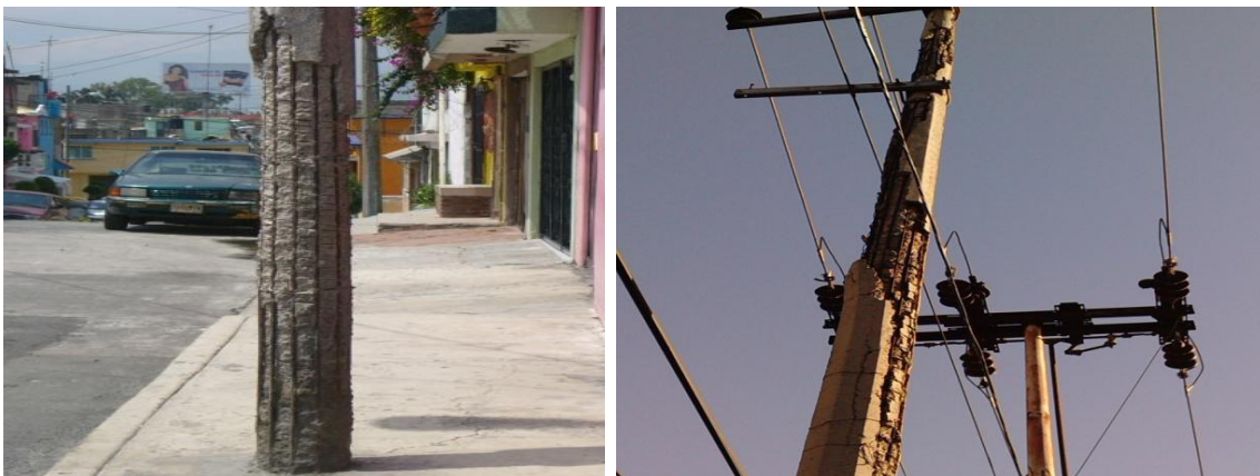
Figura 4.13 Postes de concreto reforzado con las varillas expuestas muy deteriorado por el tiempo que datan de los años 60's.

Los daños en la infraestructura eléctrica subterránea en el caso que se presentara un sismo como el que fue en 1985 de 8.1 grados Richter, donde los daños se concentraron en las delegaciones Benito Juárez y Cuauhtémoc del centro de la capital, además de ser daños muy altos, el tiempo en lograr a empezar a cuantificar los daños es de varios meses, en estos casos también se hacen seccionamientos de los lugares dañados y dejando sin energía toda la zona afectada, para posteriormente comenzar a restaurar las líneas subterráneas que alimentan a toda esta zona. En la figura 4.13 se aprecian postes que datan de los años 60's con un deterioro muy importante ya que estos no resistirían ningún tipo de sacudida porque se caerían.