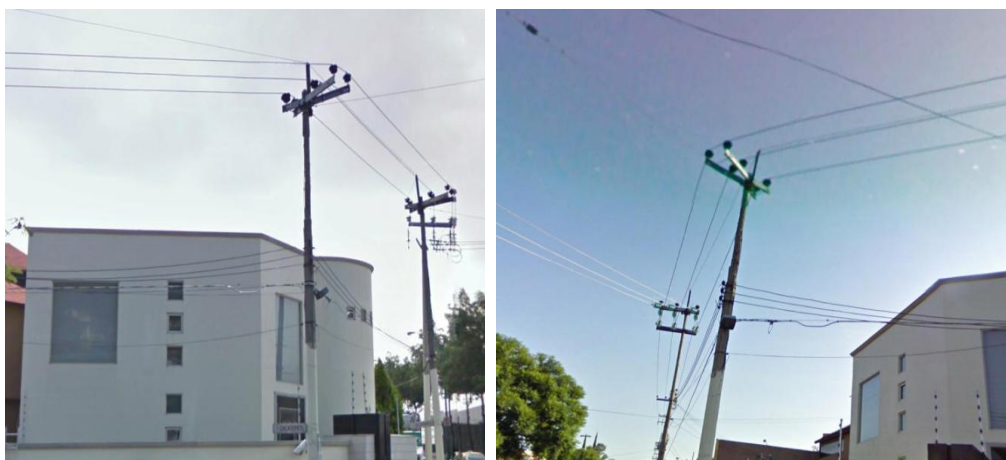
Figura 4.4 poste de concreto reforzado a punto de venirse debajo de la parte superior.

En la figura 4.4 se muestra un poste de concreto reforzado con las varillas expuestas y con la parte superior apunto de venirse abajo en la parte superior de la sustentación de las crucetas de acero que sostienen a las líneas de mediana tensión, de red troncal.