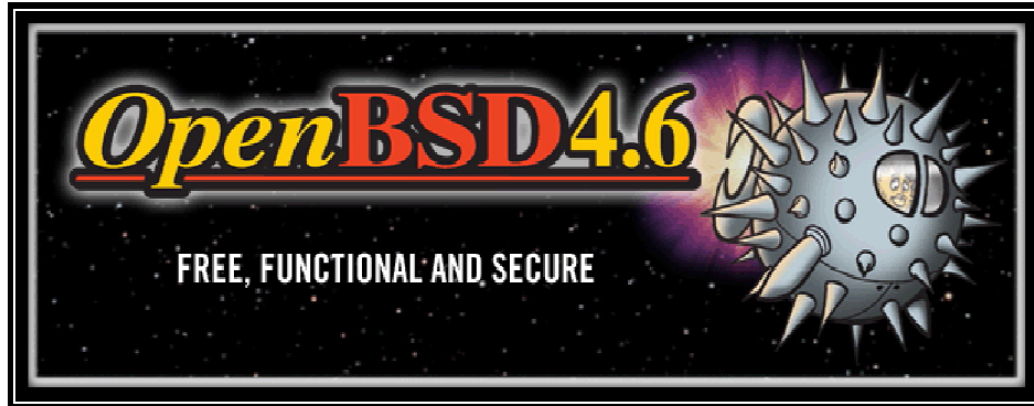
Figura 3.1 Logotipo de OpenBSD 4.6