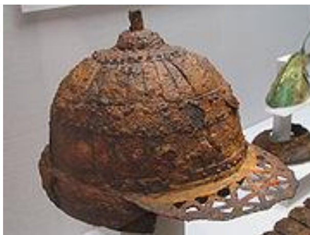
FIGURA 1.2 Casco de hierro de la Confederación Gaya, siglo V

En China se han encontrado reliquias hechas de hierro fechadas en épocas correspondientes a la Dinastía Zhou [S.M. Young, The earliest use of iron in China], en el siglo VI a. C. En 1972 en una excavación cerca de la ciudad de Gaocheng en Shijiazhuang, se localizó un tomahawk de bronce con filo de hierro fechado en el siglo XIV a. C., material que se determinó tenía un origen meteorítico.