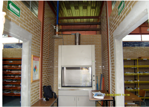
Campana de extracción de la bodega