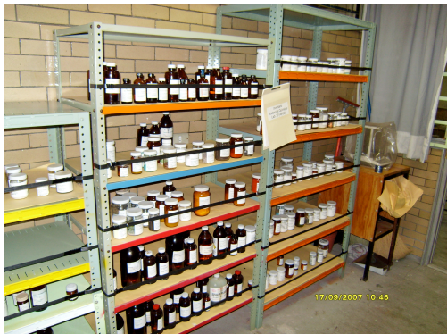
Almacenamiento de sustancias y materiales en uno de los laboratorios y explicación del contenido del rombo