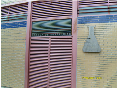
Bodega de sustancias