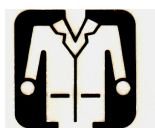
Bata de Lab.