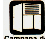
Campana de Ventilación