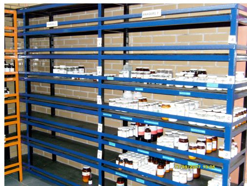
Distribución actual de las sustancias por colores en los estantes de la bodega del CCH-Sur