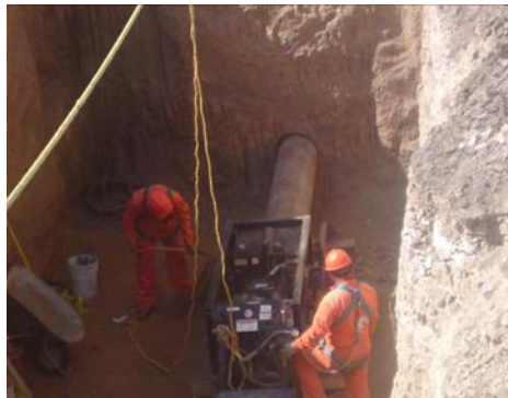
Figura 9. Cruce tuneleado INAH