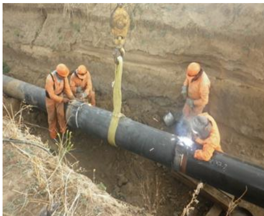
Figura 5. Empate de línea regular

Deben hacerse reparaciones duraderas de las bardas y otros cercados a través de los cuales se han tenido puertas temporales u otros medios de paso. Deben usarse materiales nuevos en las reparaciones. Las estructuras deben quedar con las mismas o mejores condiciones que había antes de la construcción. Todas las reparaciones deben ser a satisfacción de los propietarios o inquilinos. Se deben remover todos los medios temporales de acceso al derecho de vía, excepto aquellos que el proyecto señale para usos de mantenimiento o para uso del propietario del terreno, según la conveniencia. Se deben restaurar y reparar las condiciones originales de todos los derechos de vía públicos en los puntos donde fueron interceptados por el derecho de vía del ducto.