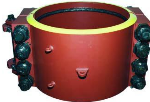
Figura 8. Envoltorio metálico para reparación de fallas

bien físico por diferentes razones técnicas, lo cual generalmente es responsabilidad del mantenimiento.