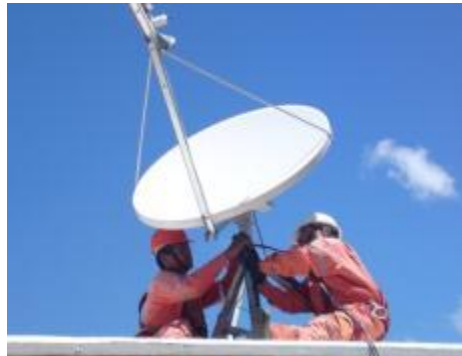
Figura 12. Sistema de telecomunicaciones