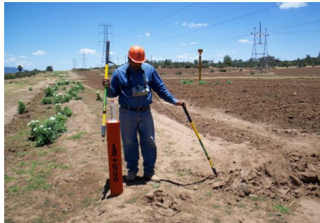
Figura 7. Postes de señalamiento y toma de potenciales