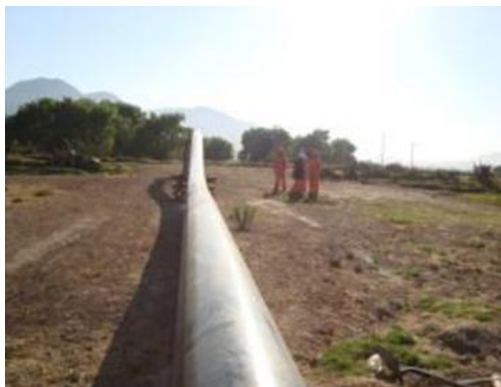
Figura 13. Ducto 18" Cima de Togo-Venta de Carpio

suministro de combustibles con un costo mínimo, maximizando el uso de los activos con una operación eficiente y segura.