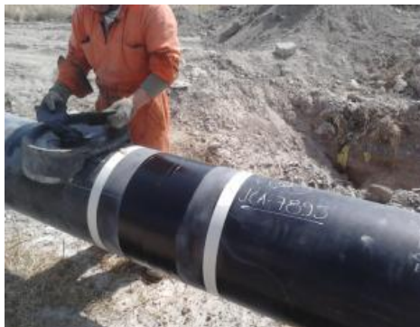
Figura 11. Parcheo de junta con recubrimiento anticorrosivo

La selección del recubrimiento anticorrosivo para el ducto 18" Cima de Togo-Venta de Carpio fue de acuerdo a las condiciones de campo y a los estudios realizados. La selección considero entre otros el análisis de las tensiones inducidas por las líneas de alta tensión que comparten el derecho de vía con el ducto nuevo.