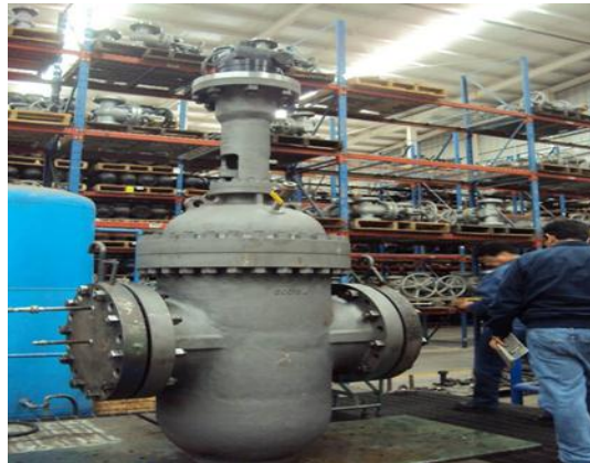
Figura 2. Válvula de compuerta para seccionamiento

seguro en ambos extremos, independiente de la presión de la línea; así como facilitar el mantenimiento del sistema. Dichas válvulas se deben instalar en lugares de fácil acceso y protegerlas de daños o alteraciones. Asimismo, se debe considerar una infraestructura para su fácil operación. La localización de las válvulas se hará preferentemente en los lugares que por necesidad de operación sea conveniente instalarse como: