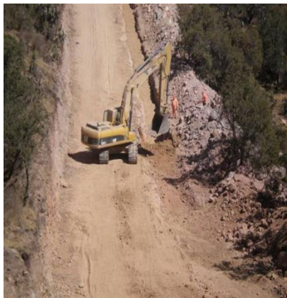
Figura 3. Excavación de zanja

El ancho mínimo en el fondo de la zanja debe ser de 0.60 m para tuberías de 12" de diámetro nominal y menores, y de 0.30 m más un diámetro para tuberías mayores de 12" de diámetro nominal. En caso de tener dos ductos en una misma zanja se debe garantizar la separación mínima especificada en III.8, mediante la colocación de algún material ligero y removible con herramientas manuales, por ejemplo inyectando poliuretano.