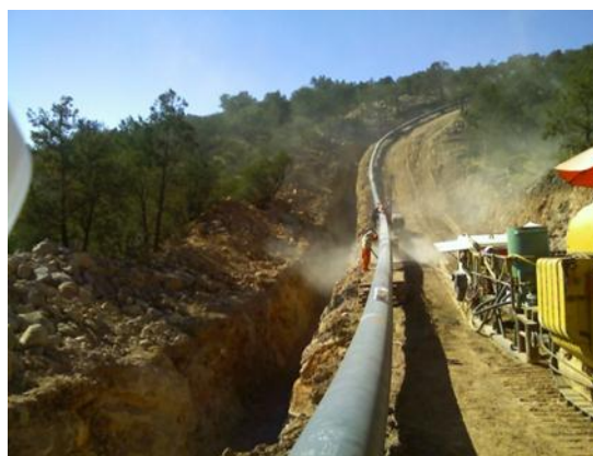
Figura 1. Construcción de línea regular

El objetivo es dar un panorama general sobre los aspectos básicos del diseño, construcción, inspección y mantenimiento tanto de la línea regular, instalaciones superficiales, así como de las obras especiales, acometidas e interconexiones, de los sistemas de ductos para transporte y recolección de hidrocarburos.