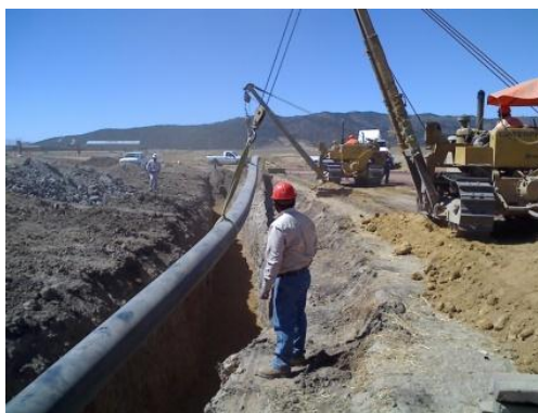
Figura 4. Bajado de lingada

Se debe tener cuidado de no dañar el recubrimiento anticorrosivo durante el bajado y relleno de la zanja. El material producto de la excavación debe ser devuelto a la zanja eliminando todo aquello que pueda dañar el recubrimiento, de manera que después del asentamiento la superficie del terreno no tenga depresiones y salientes en el área de la zanja o que el montón de tierra lateral interfiera con cualquier tráfico eventual o normal en el lugar.