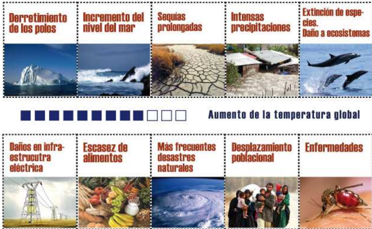
Figura 2. Consecuencias Cambio Climático

bustibles por su alta rentabilidad, dejando una crisis alimenticia difícil de subsanar.