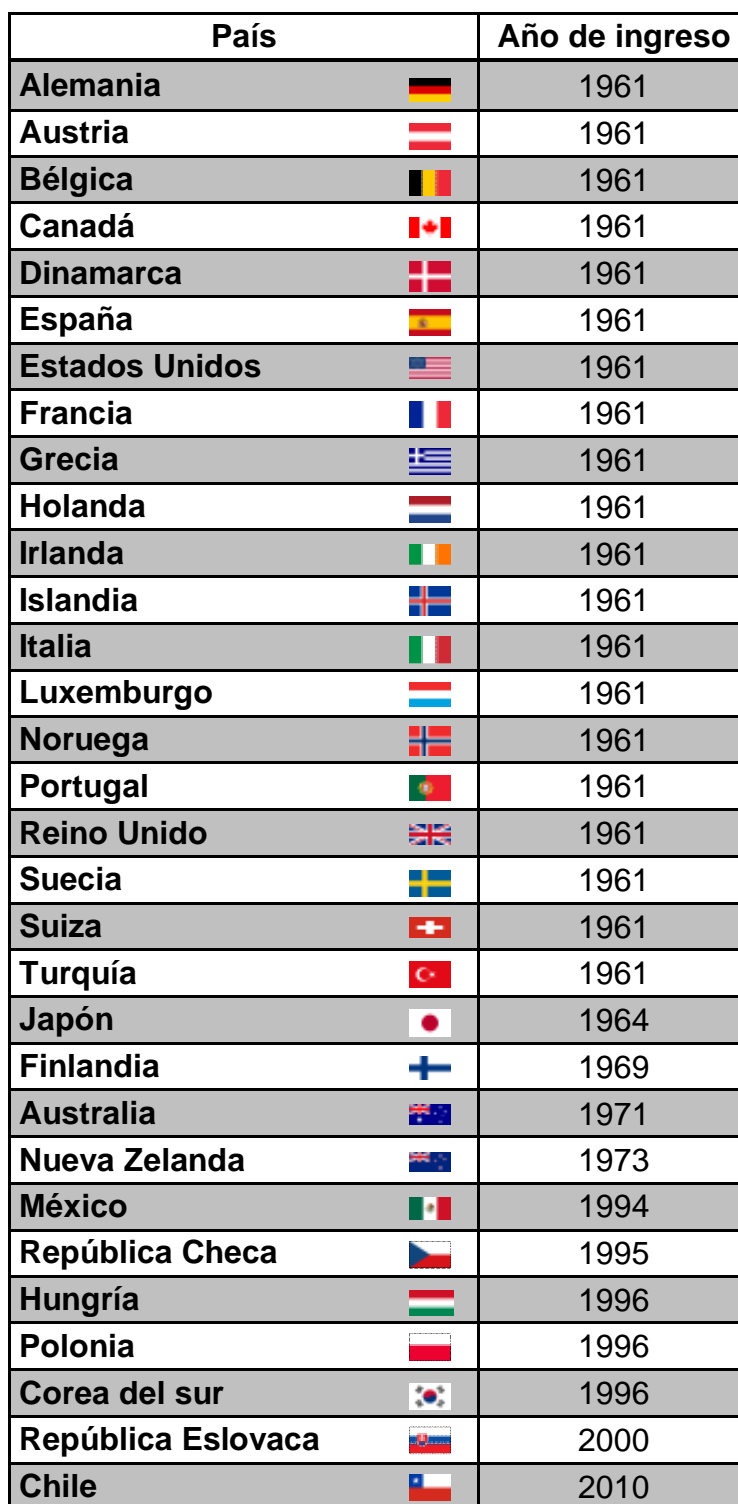
Tabla 2.6 Países miembros de la OCDE [6].