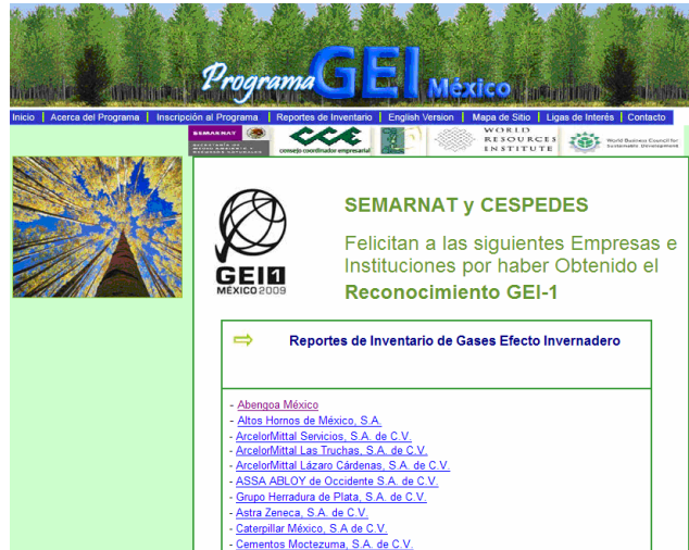
Fig. 16 Programa GEI México

En los cursos impartidos en Abengoa, se sugiere a los proveedores la participación en dicho programa, con miras a que cuando sea obligatorio ya estén participando en él. Cabe mencionar que muchos de los inscritos comenzaron reportando sus emisiones para Abengoa México.