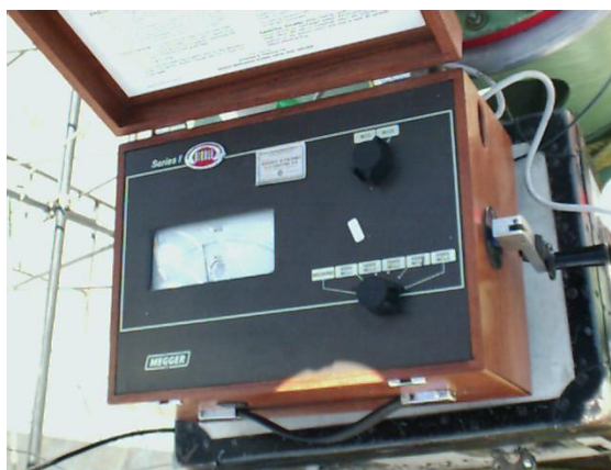
Foto 35. Megger para medir la resistencia de aislamiento

En cables de media tensión (5-35 [kV]), es recomendable realizar la prueba a 5 [kV] como mínimo. Sirve para determinar el estado que guarda el aislamiento en general. Es útil para evidenciar fallas graves de instalación y/o de obra de mano defectuosa. Para la medición de la resistencia de aislamiento se utiliza un megger que puede ser manual, eléctrico o con motor, conectando el borne positivo al conductor por medir y el borne negativo a la pantalla del cable, y al sistema de tierras.