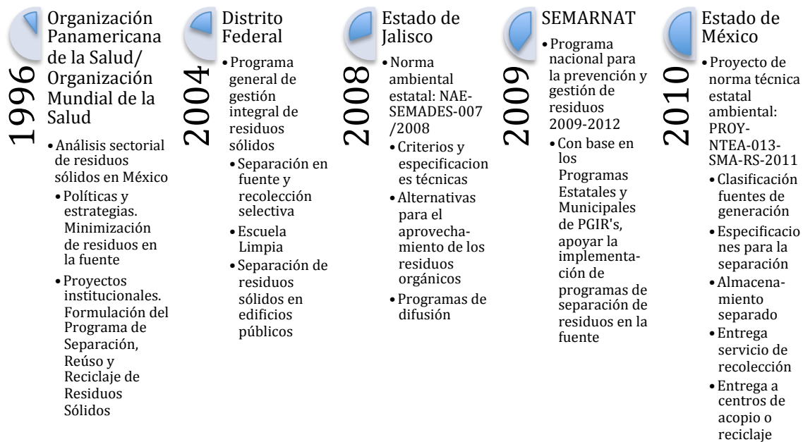
Figura 2. Hitos en los Programas de Separación de Residuos.