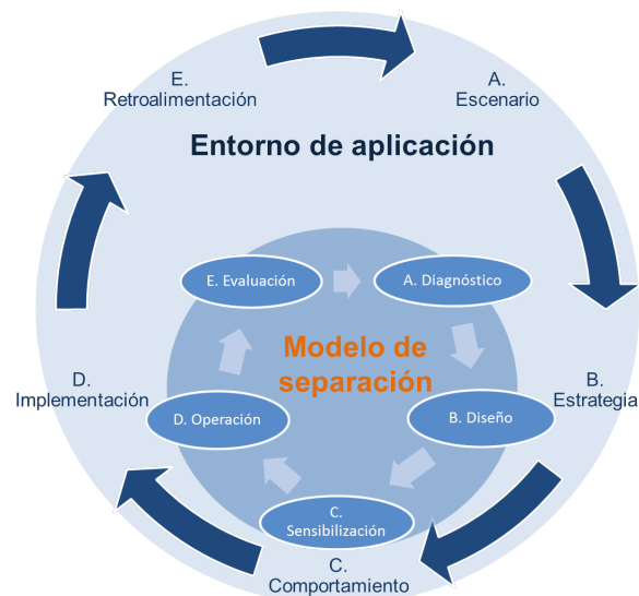
Figura 1. Ciclo de proyectos para la implantación de PSR en su entorno de aplicación.

La metodología del trabajo se basó en el ciclo de proyectos, según el cual existen procesos enmarcados en un entorno de aplicación, es decir, la ocurrencia de los procesos está directamente relacionada con el lugar, momento y situación, aspectos del contexto social, ambiental, económico, cultural y político. Factores como el clima, demografía, actividades productivas, topografía, tipo de gobierno, entre otros, son independientes y particulares para cada proyecto de separación de residuos (PSR) que se pretenda implantar, esta conceptualización se ejemplifica esquemáticamente en la figura 1.