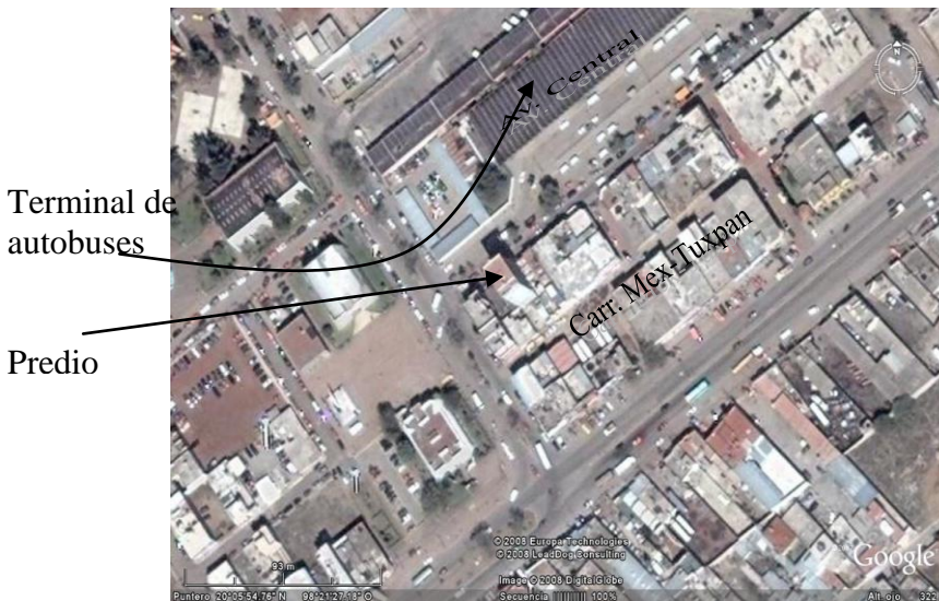
Fotografía Número 1. Vista aérea de la localización del predio.

Por lo pronto, el hecho de que el predio esté cerca de la Central Camionera, permite pronosticar, que tendrá un buen índice de ocupación.