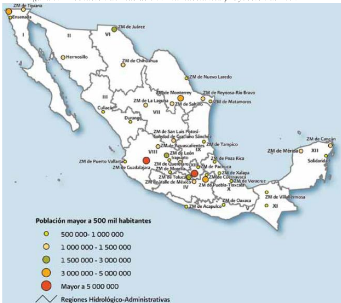
Figura 5.2 Población de más de 500 mil habitantes proyección al 2030

Para el año 2030, se estima que en México más de la mitad de los habitantes del país se concentren en 36 núcleos de población con más de 500 mil habitantes. En la siguiente figura se muestran todos los núcleos de población que en ese año contarán con ésta característica: