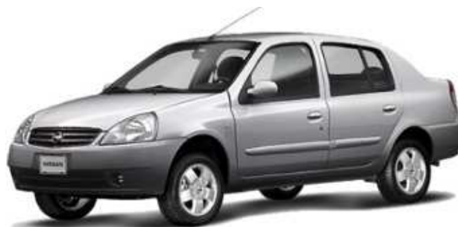
Figura G Platina

En el año 2000, se llega a 3,000,000 de vehículos producidos en México y un año después el Tsuru alcanza el 1,000,000 de vehículos vendidos en su historia. En el 2002, como resultado de la Alianza sale al mercado el PLATINA.