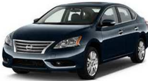
Figura I Sentra 2014

2013 Arranca la producción de la tercera planta de Nissan en México, Aguascalientes 2, que actualmente produce el vehículo Sentra.