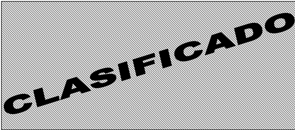
Fig. M Calendario de actividades

Teniendo en mente las actividades a realizar en las subsecuentes 3 semanas (como diseño) se genero una lista de actividades junto con los responsables de las mismas para dar un seguimiento diario, pues tenía 1 semana para definir contramedida, 1 para obtener la aprobación de las áreas y otra más para generar prototipos para probar en planta y en las instalaciones de certificación y así poder hacer las evaluaciones correspondientes.