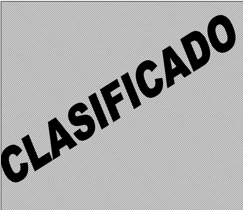
Fig. R Detalle de propuesta 3

Conclusión: Esta fue la propuesta que se acepto y se valido para realizar la prueba de impacto. Ya se había juzgado OK por el área de manufactura.