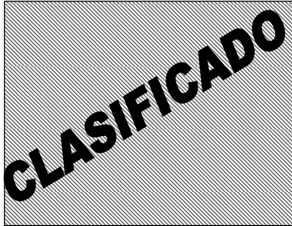
Fig. L BRKT A EN VEHICULO

Tras varios estudios y revisiones se encontró que el punto A de sujeción del dispositivo contra un BRKT al momento de ensamble tenía un ángulo de 90°, sin embargo al momento del impacto se abría a 45° y no lograba mantenerse en su posición por lo que la parte se separaba. Al haberse identificado la causa raíz, se debía definir como mejorar la condición de resistencia al impacto.