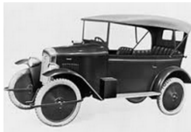
Figura A DAT

La historia de Nissan se remonta a Kawaishinsha Co., una fábrica de automóviles fundada por Masujiro Hashimoto en el distrito de Azabu-Hiroo, Tokio en 1911. Hashimoto era un pionero en la industria del automóvil de Japón desde sus comienzos. En 1914, un pequeño coche de pasajeros fue desarrollado basándose en su propio diseño, y en el año siguiente el coche hizo su debut en el mercado bajo el nombre de Dat. Dat representa las primeras letras de los apellidos de los tres soportes principales de Hashimoto: Kenjiro Den, Rokuro Aoyama y Meitaro Takeuchi.