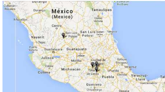
Figura F Localización de Nissan en México

Así mismo arranca la producción en la Planta de Nissan Aguascalientes (1) con una inversión de $1,300 millones de dólares.