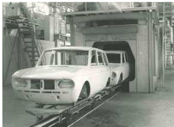
Figura E Planta de Civac (1965)

En 1961 se constituye Nissan Mexicana S.A DE C.V y tan solo 5 años después arranca operaciones la planta de Cuernavaca, ésta fue la primera planta de Nissan establecida fuera de Japón. En ese año se produce el primer automóvil mexicano, el Datsun Sedán Bluebird.