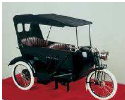
Figura B Groham

Jitsuyo Jidosha Co., Ltd., otro precursor de Nissan, fue establecida en Osaka en 1919 para fabricar los vehículos Gorham de tres ruedas, diseñados por el ingeniero americano William R. Gorham. Las herramientas, los componentes y los materiales fueron importados por la compañía de los Estados Unidos, convirtiéndola en una de las más modernas de aquellos tiempos.