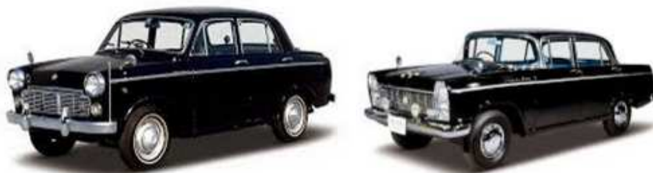
Figura D Bluebird & Cedric

El Bluebird 1959 y el Cedric 1960 cautivaron a los compradores japoneses. En 1966, Nissan se fusionó con Prince Motor Co. Ltd., agregando los renombrados modelos Skyline y Gloria a su línea de productos, e incorporó a un personal excepcional de ingeniería que continuó la excelente tradición de las compañías aéreas de Nakajima y de Tachikawa, que previamente fabricaban distinguidos motores de avión.