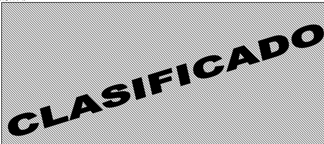
FIG J. Vista trasera del punto de fijación "A"

Debido a que ya se habían realizado 2 lotes físicos con éxito (H1 Y H2) y se estaba desarrollando P1 cuando se recibió la información del grupo de seguridad, el dispositivo que sostiene la llanta de refacción del vehículo se separaba del punto de sujeción A.