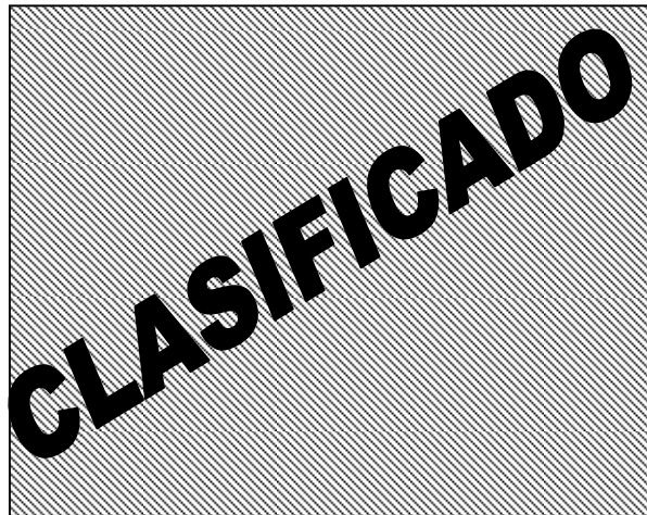
Fig. P Detalle propuesta 2

Conclusión: El tiempo de desarrollo aumentaba porque era una modificación más agresiva al herramental, aunado a esto el mal desempeño que podía generar en el ensamble, se dio juicio NG.