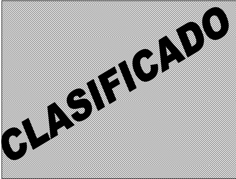
Fig. Q Detalle de propuesta 3

Conclusión: El tiempo de desarrollo aumentaba porque era una modificación más agresiva al herramental, aunado a esto el mal desempeño que podía generar en el ensamble, se dio juicio NG.