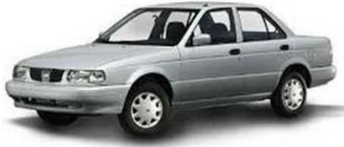
Figura H Tsuru 2010

Para 2010 el Tsuru se consolida como líder del mercado mexicano.