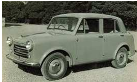
Figura C Primer Datsun

Los coches Datsun simbolizaron los avances rápidos de Japón en la industrialización moderna, según lo evidenciaba el eslogan de esos días, "el sol naciente como bandera y el Datsun como coche de opción."