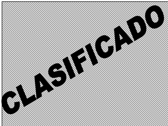
Fig. K Comparativa de los sistemas (A vehículo en desarrollo, B vehículo en mercado)

Este sistema que se separaba era similar al de otro vehículo, que anteriormente se había evaluado para impacto donde no se había presentado esta situación, lo que dificultaba el poder encontrar la causa raíz, puesto que no había una experiencia previa con el sistema.