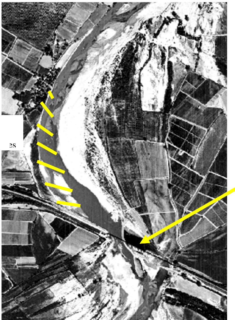
Figura 14 Espigones sobre la margen derecha

propone reencauzar el río reubicando las zonas agrícolas instaladas en las márgenes derechas e izquierda del río (Figura 15).