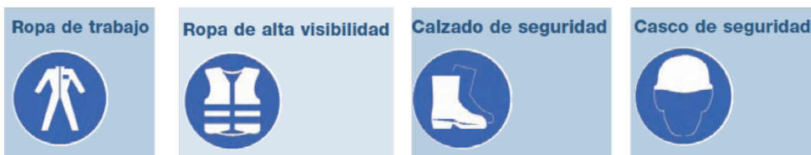
Fig. 81. Algunos símbolos de elementos de protección personal

Los elementos de protección personal ( Fig. 81 ) a emplear durante la operación y actividades de construcción: