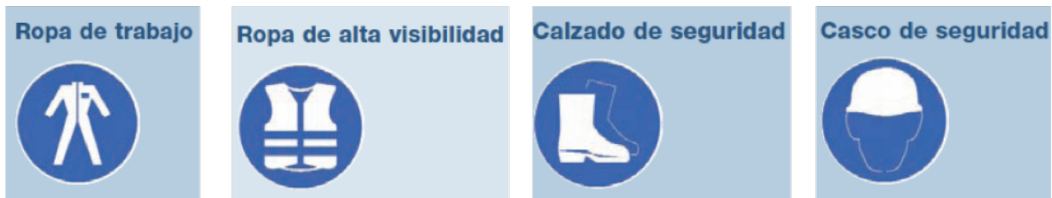
Fig. 81. Algunos símbolos de elementos de protección personal

Los elementos de protección personal ( Fig. 81 ) a empelar durante la operación y actividades de construcción: