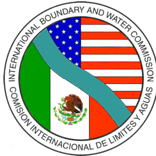
Imagen III.1.1. Emblema de la Comisión Internacional de Límites y Aguas.

Conocidos sus antecedentes, hablaremos sobre lo que actualmente es La Comisión Internacional de Límites y aguas (CILA):