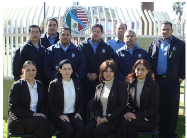
Imagen III.1.3. Personal de la Representación de la CILA en Mexicali, B.C.

A lo largo de su existencia, la Comisión Internacional de Límites y Aguas ha establecido y coordinado relaciones de cooperación con otras dependencias federales, estatales y locales en México y Estados