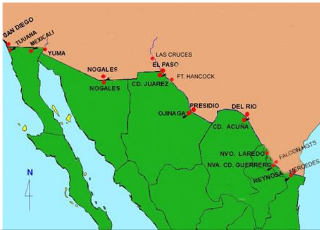
Imagen III.1.2. Oficinas de la CILA en la frontera norte.