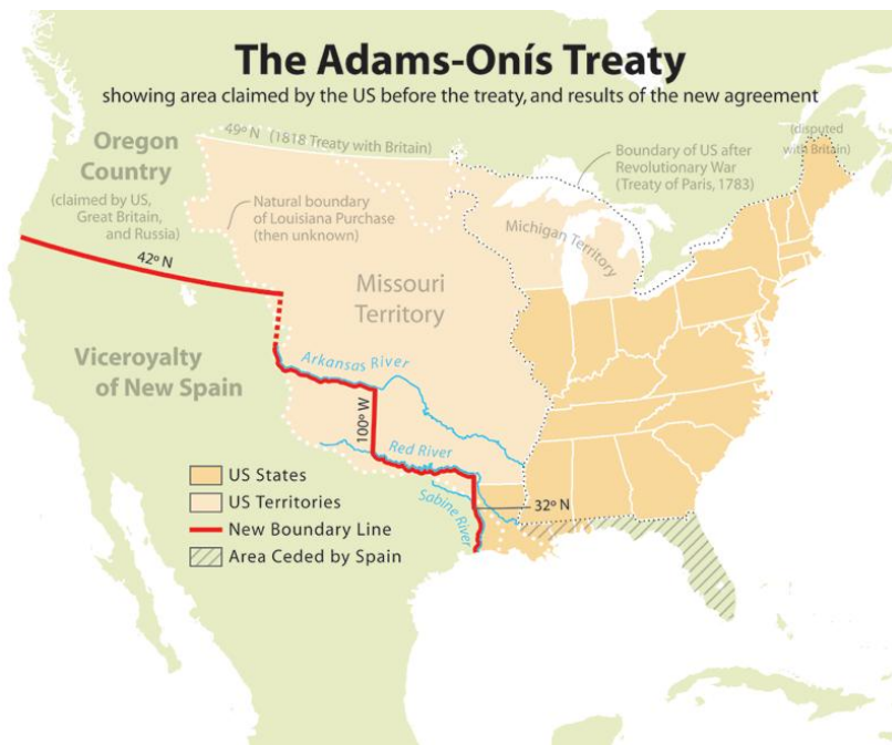
Imagen I.1.1. Frontera México-EU conforme al Tratado Adams-Onís.

Con la independencia de México fue necesario definir internacionalmente las posesiones territoriales mexicanas y en lo que respecta a la frontera norte, el tratado existente que la delimitaba con otros territorios, entre ellos los de los Estados Unidos, era el “ Tratado de Amistad Adams-Onís. Arreglo de Diferencias y Límites entre España y los Estados Unidos de América ” (Imagen I.1.1) que fue realizado entre la corona española y los estados unidos en el año de 1819, en donde Luis de Onís acudió como representante del rey Fernando VII de España y por los estadounidenses el secretario de estado John Quincy Adams. La negociación se inició en 1819 y aunque se firmó el 22 de febrero