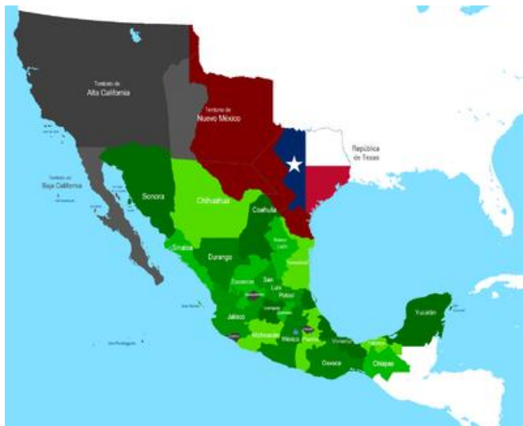
Imagen I.3.1. Mapa en el que Texas reclama el rio Bravo como frontera con México, 1837.

En 1837, un año después de la firma del Tratado de Velasco, Texas publica un mapa en el que reclama como su frontera el Rio Bravo y no el Rio nueces, siendo esta ultima su frontera original y que se tenía definida desde tiempos coloniales (Imagen I.3.1.).