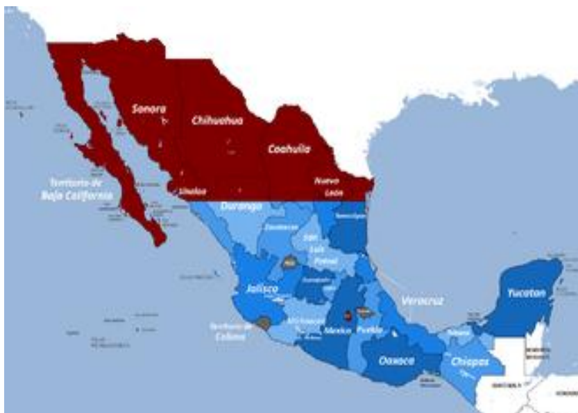
Imagen I.4.1. Propuesta de compra hasta el paralelo 25° Norte.

La situación política y financiera en México era endeble, Santa Anna había regresado al poder recibiendo unas fuerzas armadas pobres, por lo que con el fin de obtener recursos estaba dispuesto a negociar la venta de mas territorio, recibiendo una oferta por parte de Gadsden de cincuenta