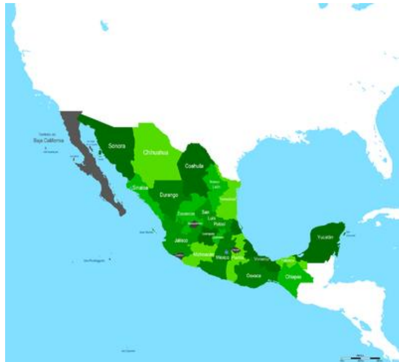
Imagen I.4.3. México después de la venta de la Mesilla en 1853.