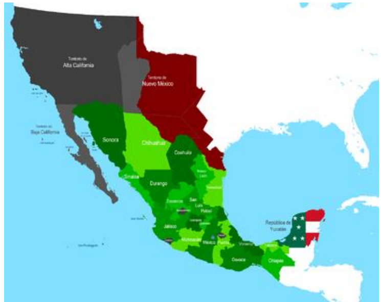
Imagen I.3.2. Mapa en el que Texas se anexa a los EU, el 29 de diciembre de 1845.

De manera paralela, el Presidente Polk envió tropas norteamericanas al territorio en disputa, esto es entre el Rio Nueces y el Rio Bravo, esta invasión fue dirigida por el General Zachary Taylor, quien pretendiendo establecer fuertes militares se interno en los territorios mexicanos que en ese entonces correspondían al Nuevo Santander (territorio perteneciente al hoy estado de Tamaulipas y que delimitaban al norte con en el rio nueces). El General Mexicano Pedro Ampudia le envía una carta al General Taylor indicándole que levante su fuerte y retire sus tropas llevándoselas al norte del rio nueces. Taylor hace caso omiso de la carta y por el contrario continua su avance al sur, hasta la desembocadura del rio bravo donde comenzó a construir el Fuerte Brown (en el actual condado de Brownsville).