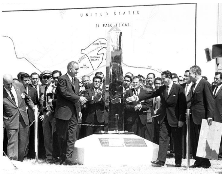
Imagen I.5.1. Presidentes Lyndon B. Johnson y Adolfo López Mateos respectivamente, develando el señalamiento que marca los nuevos límites fronterizos entre ambos países tras la devolución del Chamizal, 1964.

Fue en 1964 cuando los presidentes Adolfo López Mateos de México y Lyndon B. Johnson de los Estados Unidos se reunieron en la frontera para terminar oficialmente con la disputa (Imagen I.5.1) y en octubre de 1967, Lyndon B. Johnson se reunió con el nuevo presidente Mexicano Gustavo Díaz Ordaz en Ciudad Juárez formalizando la entrega física del Chamizal.