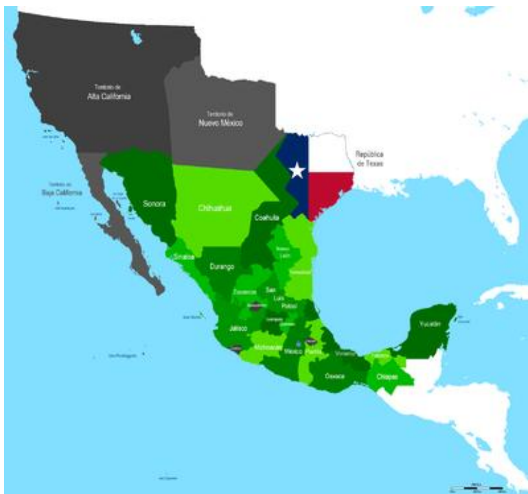
Imagen 1.2.2. Mapa que muestra el territorio Texano proclamado independiente el 21 de abril de 1836.

Dicha situación precipito la decisión del Gobierno de Texas a promulgar su Independencia de México el 21 de abril de 1836 (Imagen 1.2.2.) obteniendo como respuesta la movilización de tropas del gobierno mexicano hacia Texas bajo el mando del Gral. Antonio López de Santa Ana, quien en ese entonces fungía como Presidente de México. En esta campaña se llevaron cabo entre otras batallas, la de el sitio del Álamo, el que termino siendo tomado por el ejército mexicano obligando a los rebeldes a huir, siendo perseguidos por las tropas mexicanas, las mismas que por errores tácticos y el exceso de confianza por parte del Gral. Antonio López de Santa Ana, las lleva a ser derrotadas en la batalla de San Jacinto, siendo capturado el General