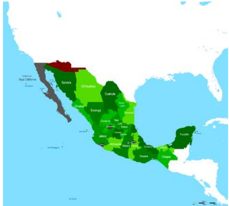
Imagen I.4.2. Territorio vendido por México a los E.U. en 1853.

Además de la renuncia al mencionado territorio, esta venta genero gran descontento en el pueblo mexicano que la vio como una traición mas del General Santa Anna, del que ya se dudaba que en su participación en la guerra con los norteamericanos de manera deliberada había contribuido a la derrota de México, dando pie al pronunciamiento del Plan de Ayutla, el mismo que finiquito definitivamente su carrera política.