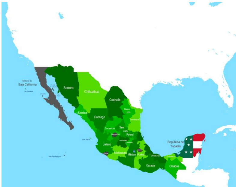
Imagen I.3.3. Mapa de México posterior al Tratado de Guadalupe Hidalgo del 2 de febrero de 1847.