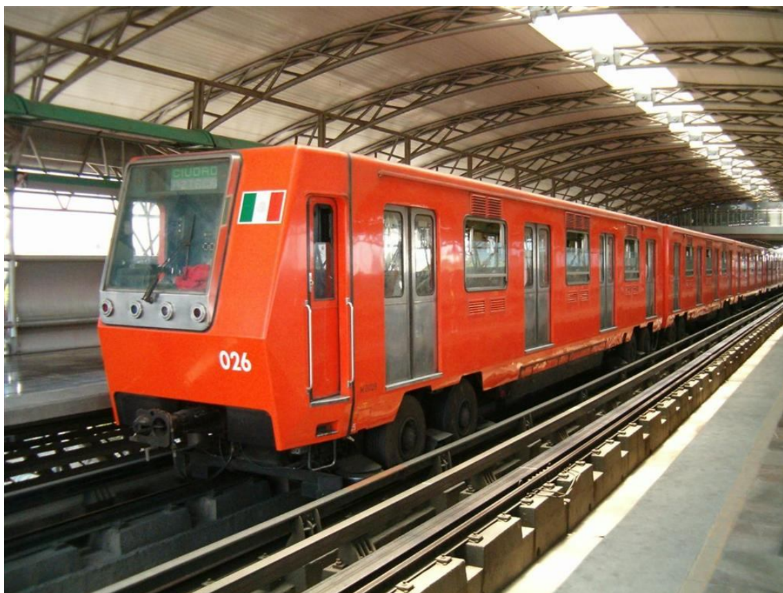
Fig.3 - Imagen del Metro de la Ciudad de México.

El Metro de la Ciudad de México es un sistema de transporte público tipo tren pesado que sirve a extensas áreas del Distrito Federal y parte del Estado de México. Su operación y explotación está a cargo del organismo público descentralizado: Sistema de Transporte Colectivo (STC) mientras su construcción queda a cargo del organismo de la Secretaría de Obras y Servicios del Distrito Federal llamado Proyecto Metro del Distrito Federal (PMDF). Se conoce coloquialmente como Metro por la contracción de tren metropolitano.