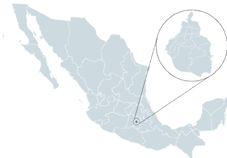
Fig.1 – Ubicación del Distrito Federal.

La Ciudad de México o Distrito Federal es la capital y sede de los poderes federales de los Estados Unidos Mexicanos, constituye una de sus 32 entidades federativas y forma con la Zona Metropolitana del Valle de México la aglomeración urbana más poblada de América y una de las más pobladas del mundo.