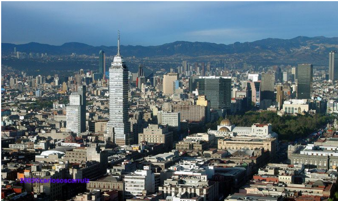
Fig.2 – Imagen de la Ciudad de México.

Hacia la década de 1980, el DF era la entidad más poblada de la República Mexicana. Tras el sismo de 1985, buena parte de la población de las delegaciones más afectadas se fue a residir a las delegaciones del sur del DF. En 1990, la mancha urbana de la ciudad ocupaba una superficie mayor que en el censo anterior, con una población más reducida. A partir de entonces, el DF como entidad federativa únicamente ha dejado de ser la entidad más poblada de México.