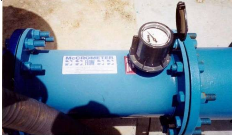
Fig. 41. Medidor volumétrico de pro pela