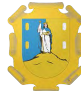
San Luis Potosí

Ley de Obras Públicas y Servicios para el Estado de San Luis Potosí Disponible en: http://www.hospitalcentral.gob.mx/29%20LEY%20DE%20OBRAS%20PUBLICAS.pdf