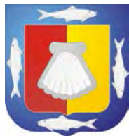
Baja California Sur

Cuenta con Ley de Obras Públicas y Servicios Relacionadas con las Mismas del Estado y Municipios de Baja California Sur