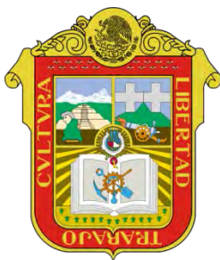
Estado de México

Ley de Obras Públicas para el Estado de México