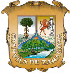
Coahuila de Zaragoza

Dispone de Ley de Obras Públicas para el Estado de Coahuila de Zaragoza.