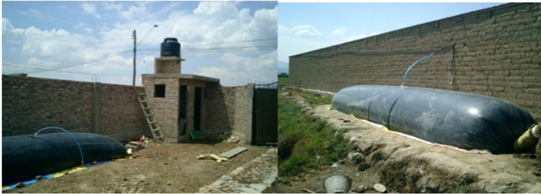
Figura 2.6 Digestores de polietileno en una granja en Bolivia.