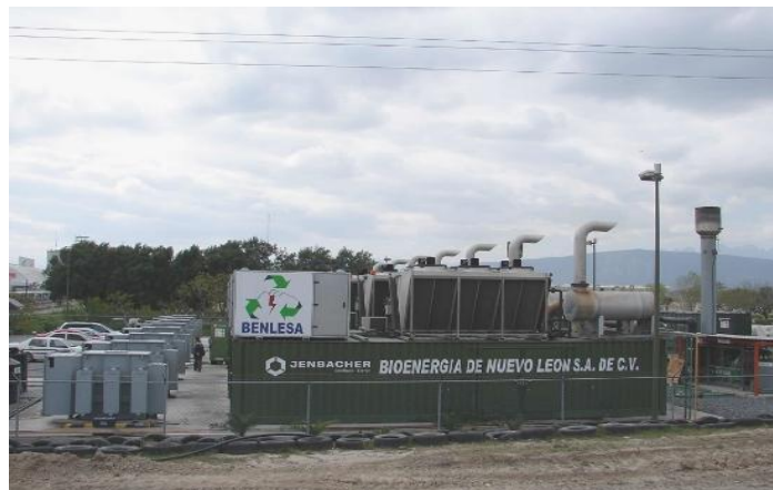
Figura 2.16 Planta de biogás en relleno sanitario en Monterrey

En Monterrey Bioenergía de Nuevo León desarrolló una planta aprovechando el biogás que se forma en los rellenos sanitarios. El sistema consiste básicamente en la extracción del biogás mediante la perforación de pozos, los cuales se conectan a un ramal central que lo dirige hacia los módulos generadores de electricidad. La Fase Monterrey I, contaba con una capacidad de generación de 7.42 MWh.