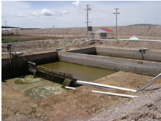
Figura 2.14 Construcción del digester Granja Delicias, Chihuahua.