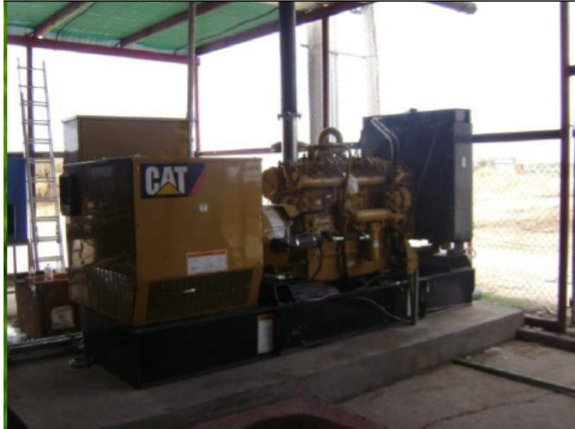
Figura 2.11 Generador de planta de biogás, Torreón.

En Torreón, Coahuila el Grupo Agrícola Vigo produce electricidad, cuentan con 2000 Vacas en producción, donde el establo demanda 120 kW y se generan 110 kW.