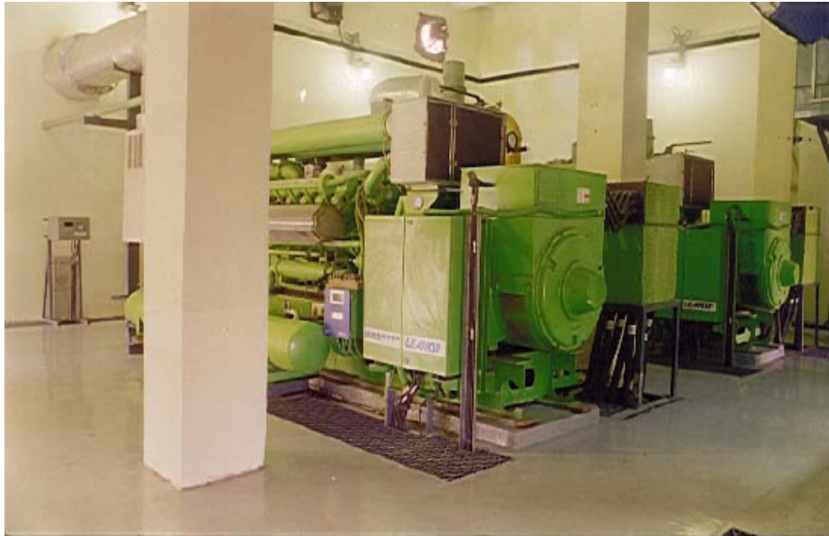
Figura 2.4 Planta de biogás de Kanoria Chem, Ankleshwar.

se usa para generar vapor para procesos de la industria química, además se aprovecha para generación de energía eléctrica.