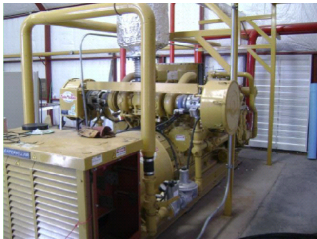
Figura 2.15 Generador Granja Delicias, Chihuahua