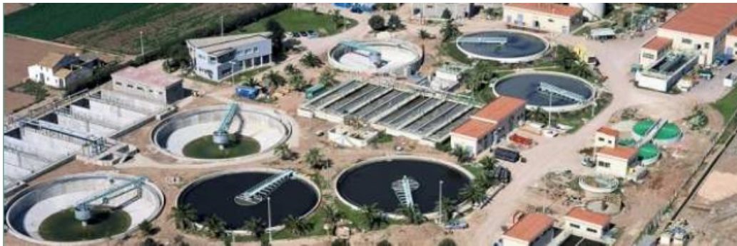
Figura 2.7 Planta de biogás con base en tratamiento de aguas residuales, Valencia.

Esta misma empresa cuenta además con otra planta de tratamiento de aguas residuales en Sevilla, con una capacidad de 225 000 m 3 /d de agua tratadas anaerómicamente, con una potencia instalada de 1 890 kW.