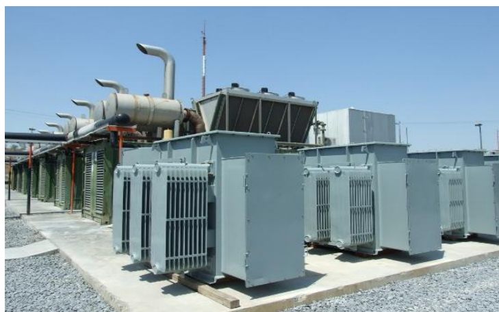
Figura 2.17 Transformadores en la planta Benlesa, Monterrey

Se piensa en la expansión de la Planta, dentro de una segunda fase, contemplando incrementar la capacidad de generación para a un total de 12.72 MWh.