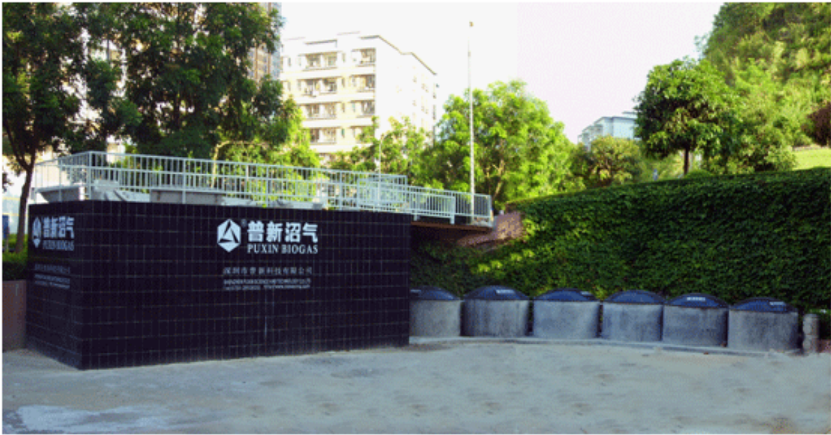
Figura 2.2 Planta de biogás en Shenhen.