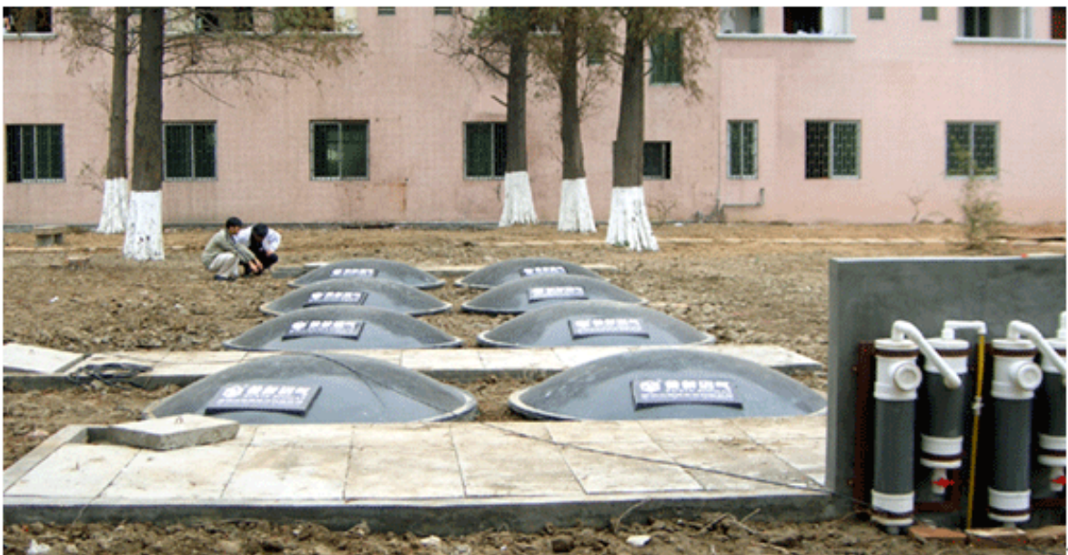
Figura 2.1 Planta de biogás en Miyun, Beijing.

La Planta Integrada de Puxin Biogas cuenta con una capacidad para 200 m 3 , está diseñada para tratar los residuos de 1000 cerdos de una granja en Miyun, Beijing. El biogás proporciona combustible a 100 familias en el campo para su uso cotidiano.