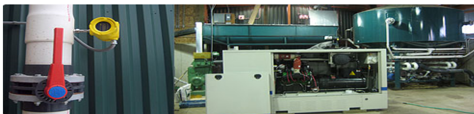
Figura 2.9 Granja Geerlings Hillside, Michigan.

En Michigan como parte del proyecto “Geerlings Hillside Farms: Methane Recovery & Electricity Generation Project”, existe una granja que recoge los desechos de alrededor de 8000 cerdos de otras granjas para su tratamiento en digestores; con lo que se obtiene biogás y fertilizante.