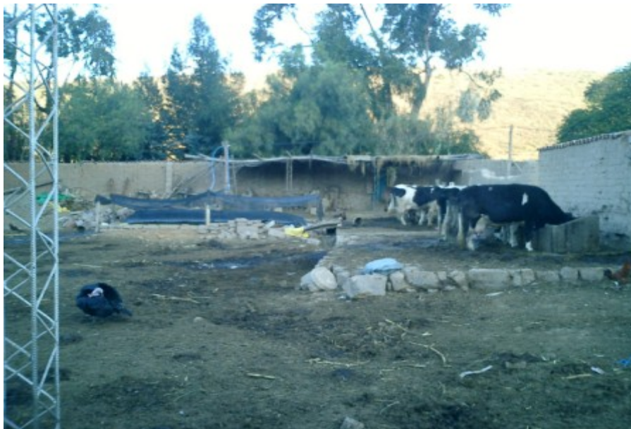
Figura 2.5 Digestores tubulares. Bolivia.

A través del Programa Viviendas Autoenergéticas se construyen digestores de polietileno tubular, cuyo combustible generado se utiliza para calefacción y cocción en los hogares.