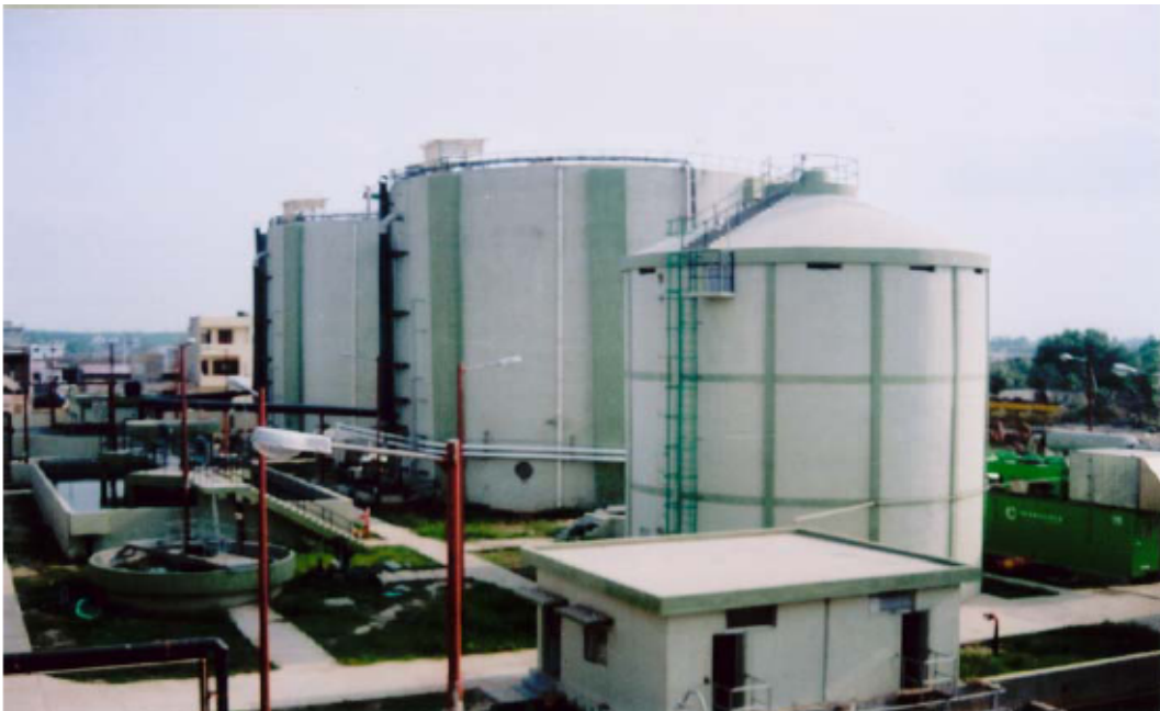
Figura 2.3 Planta biogás de Punjab.

En nueva Delhi, se construyó la planta en Punjab, con capacidad de 1 MW. Esta planta maneja desechos de animales de granja.