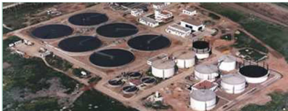
Figura 2.8 Planta de biogás con base en tratamiento de aguas residuales, Sevilla.