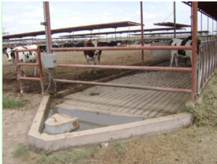
Figura 2.12 Sistema de captación de residuos vacunos. Torreón