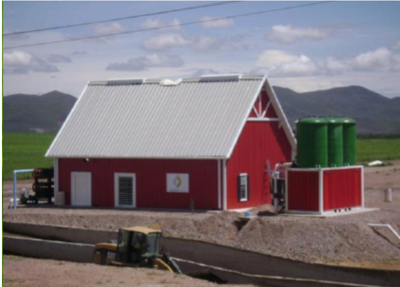
Figura 2.13 Granja Delicias, Chihuahua.