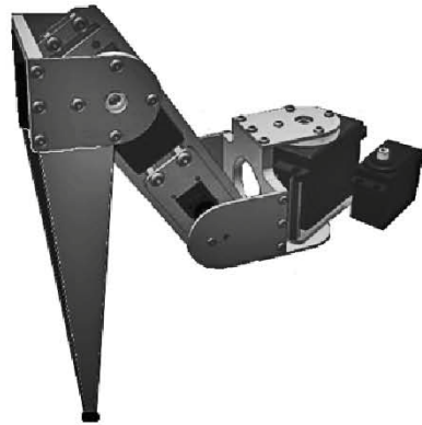
Figura. 5.2 Prototipo experimental 1

Como se mencionó, de los tres diseños éste es el más largo de longitud, los antebrazos están conformados de lámina de acero inoxidable y una longitud de 18cm, los servomotores que daban la articulación HOMBRO y CODO están sobre el mismo segmento que es el brazo de longitud de 5 cm. Todas la articulaciones están conformadas por aluminio. Este modelo cuenta con un punto de contacto de 0.5 cm de diámetro y se coloco una goma como material de fricción con la superficie.