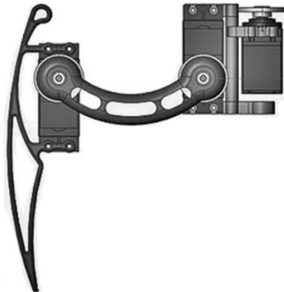
Figura. 5.3 Prototipo experimental 2

El segundo diseño figura 5.3 (ver anexo para detalles) fue basado en un insecto hexápodo, el Cicindela hudsoni o escarabajo tigre. Este insecto curiosamente posee el record de ser el insecto terrestre más veloz sobre la tierra al alcanzar velocidades de 2,5 metros por segundo, es decir, 120 veces su propia longitud en un segundo. A diferencia de la especie anterior, esta se caracteriza por tener patas relativamente cortas, realizar pasos cortos y continuos en un lapso muy corto de tiempo, en este caso la idea es realizar muchos pasos en poco tiempo para obtener una buena velocidad de avance.