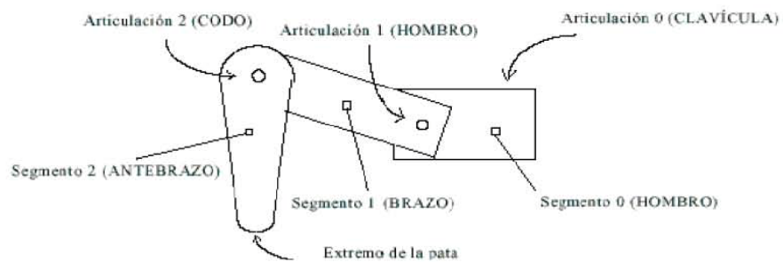
Figura. 5.1 Pata de triple articulación

El diseño básico de las patas con triple articulación es el que se muestra en la figura 5.1: