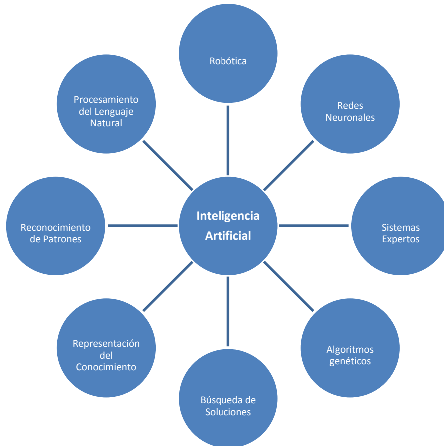
Figura 24. Técnicas de la IA.

Desde el punto de vista de la Ingeniería la Inteligencia Artificial utiliza diversas herramientas en la solución de problemas, estas herramientas se presentan en distintas técnicas, mismas que proveen elementos fundamentales en las áreas de la Inteligencia Artificial, entre las técnicas básicas podemos citar: