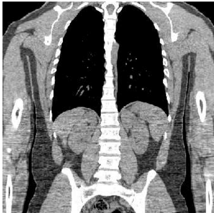
Imagen 89. Ejemplo de tomografía del cuerpo humano

El formato genérico del archivo de DICOM consiste en dos partes: header seguido inmediatamente por un data set de DICOM. El data set de DICOM contiene la imagen o las imágenes especificadas. El header contiene sintaxis de transferencia UID (identificador único) que especifica la codificación y la compresión del data set.