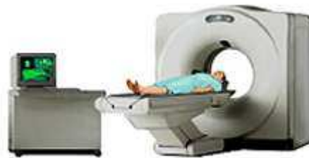
Imagen 86. Scanner CT

La tomografía computarizada (CT sus siglas en ingles) es un método de diagnóstico basado en la emisión de rayos X alrededor del cuerpo y la recepción de la señal en detectores especiales lo que permite obtener imágenes de las estructuras corporales por planos, el método permite también la medición de la densidad de las diferentes estructuras estudiadas lo que a su vez favorece el diagnóstico.