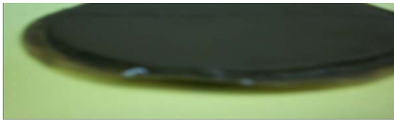
(Figura 2 Foto de Enjarre de lodo de perforación)

Enjarre: Es una capa o película delgada de lodo que se forma en las paredes del agujero. Se presenta principalmente en aquellas formaciones permeables; el espesor de la capa puede variar de 1 a 4 mm. Cuando el enjarre no se forma, el lodo invade las formaciones permeables. Para la formación de enjarre, es esencialmente necesario que el lodo contenga algunas partículas de un tamaño muy pequeño para el cierre de los poros de la formación. Los enjarres pueden ser compresibles o incompresibles, dependiendo de la presión a la que sean sometidos. La formación del enjarre va a depender principalmente de la pérdida de agua y de la permeabilidad de la roca.