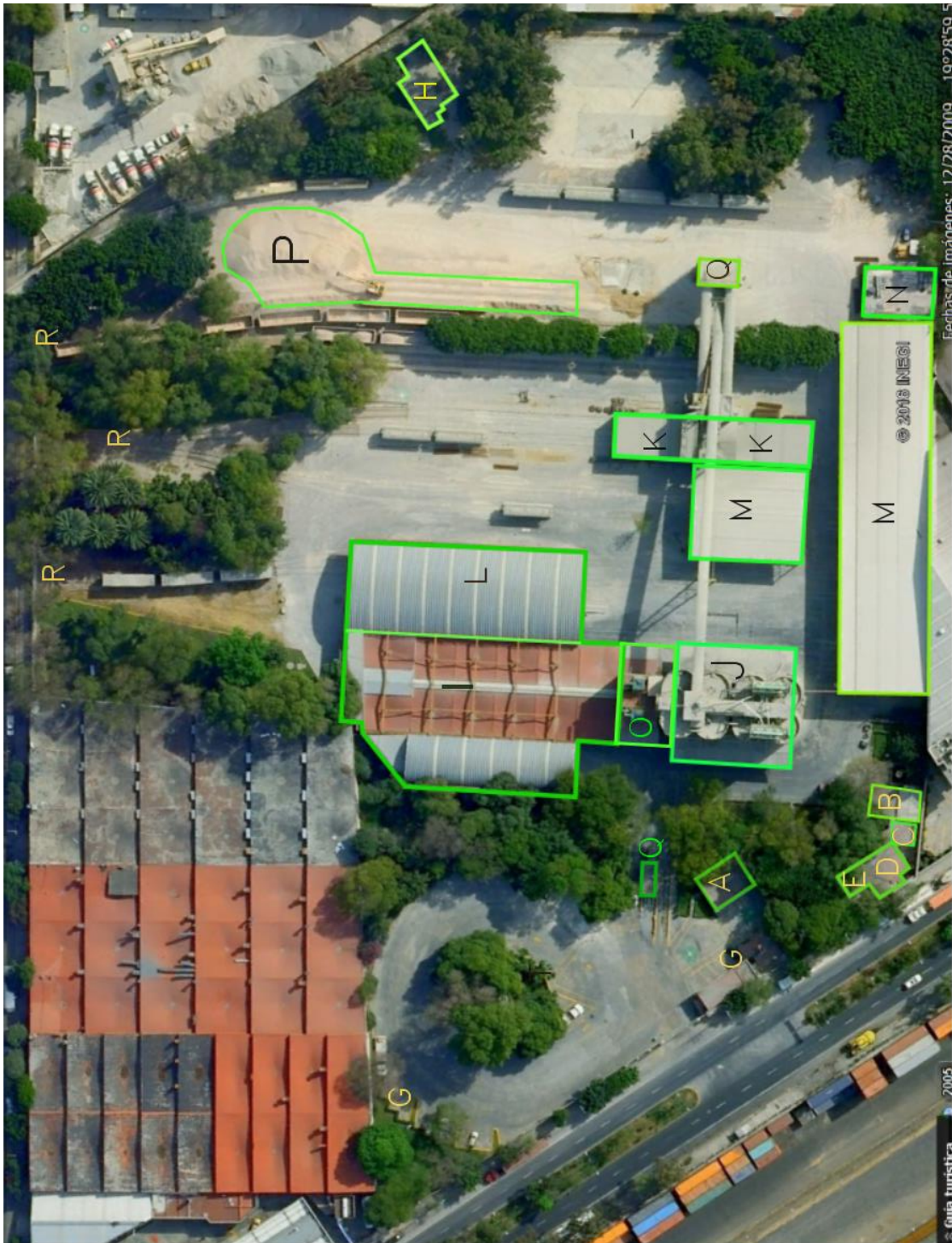
Figura 1.