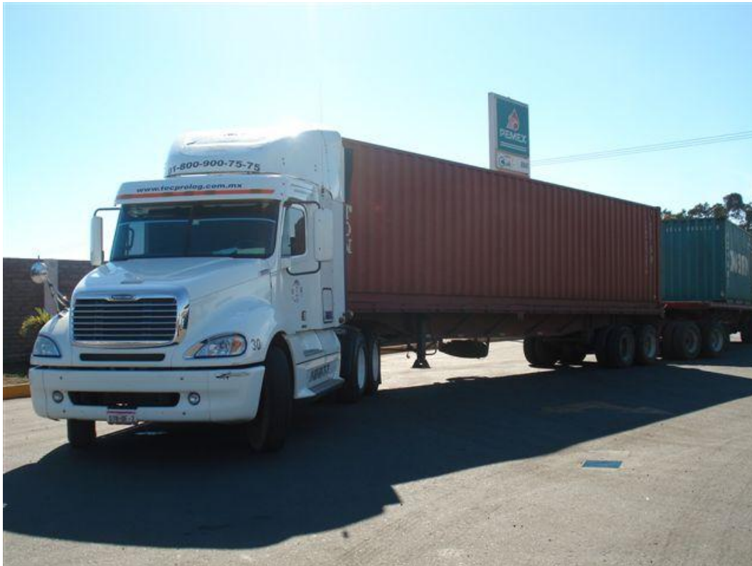
TRACTOCAMION SALIENDO DEL PUERTO DE MANZANILLO CARGADO EN FULL CON UN CONTENEDOR DE 40'Y UN CONTENEDOR DE 20'